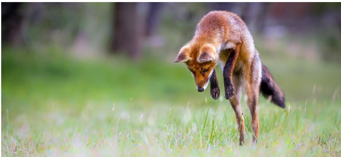
Bild 2: FOX, kompakt, einfach, clever und flexibel in jede Richtung

Bruno ist sehr anpassungsfähig und hat sich bereits in allen möglichen Ländern, wie z.B. Thailand, Malaysia, den USA, Chile, Usbekistan und auch in den meisten europäischen Staaten niedergelassen. Er produziert für Ingenieur Büros, wie HEMI, ein sehr erfolgreiches 6-Mann-Unternehmen, aber auch für multinationale Firmen, wie z.B. Zollner, eine der grössten EMS Firmen der Welt mit 7'000 Mitarbeitern.