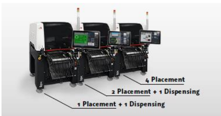
Bild 5: FOX1, FOX2, FOX4 mit allen Bestückköpfen und Optionen, nachrüstbar im Feld.

Was bringt die Zukunft? Der Release von PUMA, dem grossen Kollegen von FOX! Er wird sich an der Productronica 2017 in München auf Stand A3-218 dem interessierten Publikum entsprechend vorstellen. Auch über diese neue Maschinenentwicklung erfahren Sie mehr im nächsten „The Pack“.